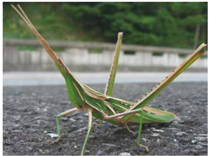
写真/シヨウリヨウバッタ 前四本の脚で植物によじのぼる

もし「昆虫とは6本脚で歩くものだ」という先入観をもって聖書の記述は間違っていると批判するなら、