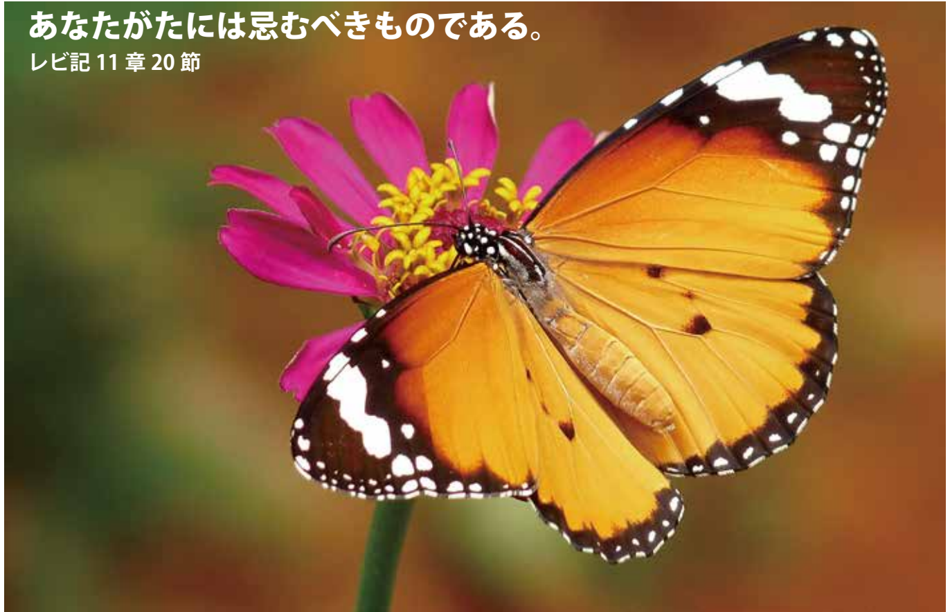
写真/カバマダラ イスラエル他さまざまな国に生息 日本では奄美大島以南に生息するが、九州や四国などでも見かけられることがある