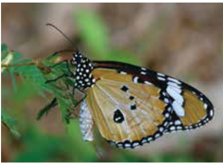
写真/羽を閉じているカバマダラ 脚の数は何本？

4本脚で歩き回るものの1つは、タテハチョウ科に属する蝶の仲間です。タテハチョウ科は、生物学の分類で言えば、その下位に12の『亜科』があり、それらは600以上の『属』に分かれ、さらに5,000以上の『種』の存在が確認されています。チョウの仲間の中では、シジミチョウ科に次いで第2位の種の多さを誇っています。2 その分布は、南極大陸を除く多くの箇所に広がっ