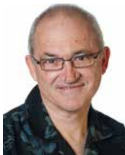
ジョン・ハートネット博士

ジョン・ハートネット博士は、オーストラリアのアデレード大学准教授(物理学/宇宙論)で、世界で最も精巧な時計であるサファイア時計の発明者の一人です。