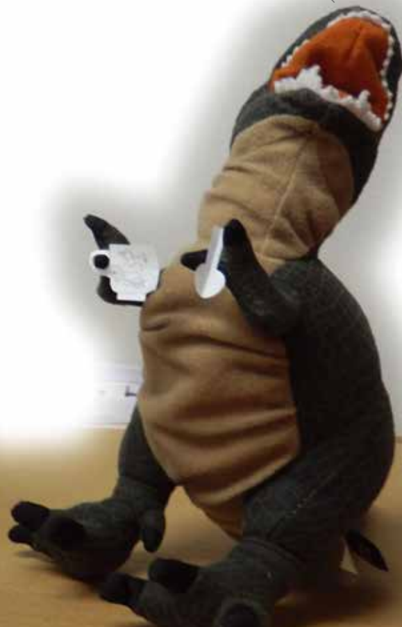
「恐竜たちとティータム」 ペーパークラフト/サネミツ