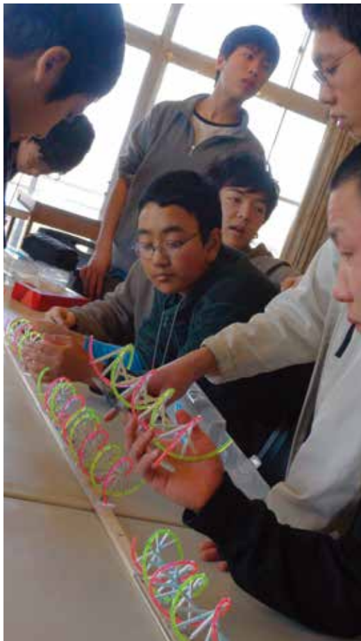
写真 / 2012年春の青少年セミナー