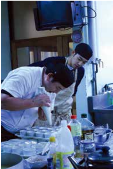
SYME シェフの心のこもった絶賛メニュー

講演内容：「地質学、徐々にではなく急激に」「創造主のかたち」「教科書が変わる」「ノアの洪水」他