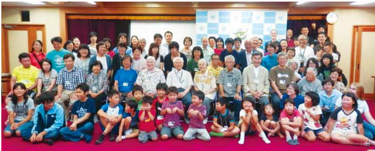
第三回聖書と科学カンファレンス／硯川ホテルにて

これを聞いた人々はみな、心を一つにして、 神に向かい、声を上げて言った。「主よ。あ なたは天と地と海とその中のすべてのものを 造られた方です。」使徒の働き 4章 24 節