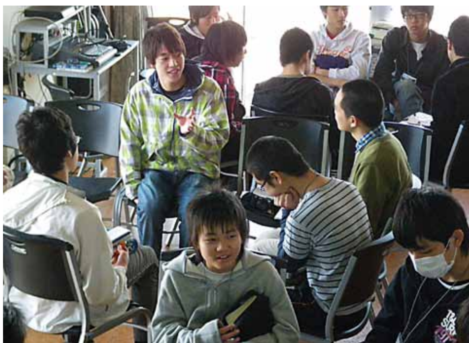
写真 2011年青少年向け創造論セミナーより

御赦しの中、みなさまの励ましと祈りに支えられているとつくづく思われています。2012年もみなさまの祈りのなかで、ジェネシスジャパンに託された主のご計画実現に向けて一歩、一歩、歩を進めて行きたいと思います。